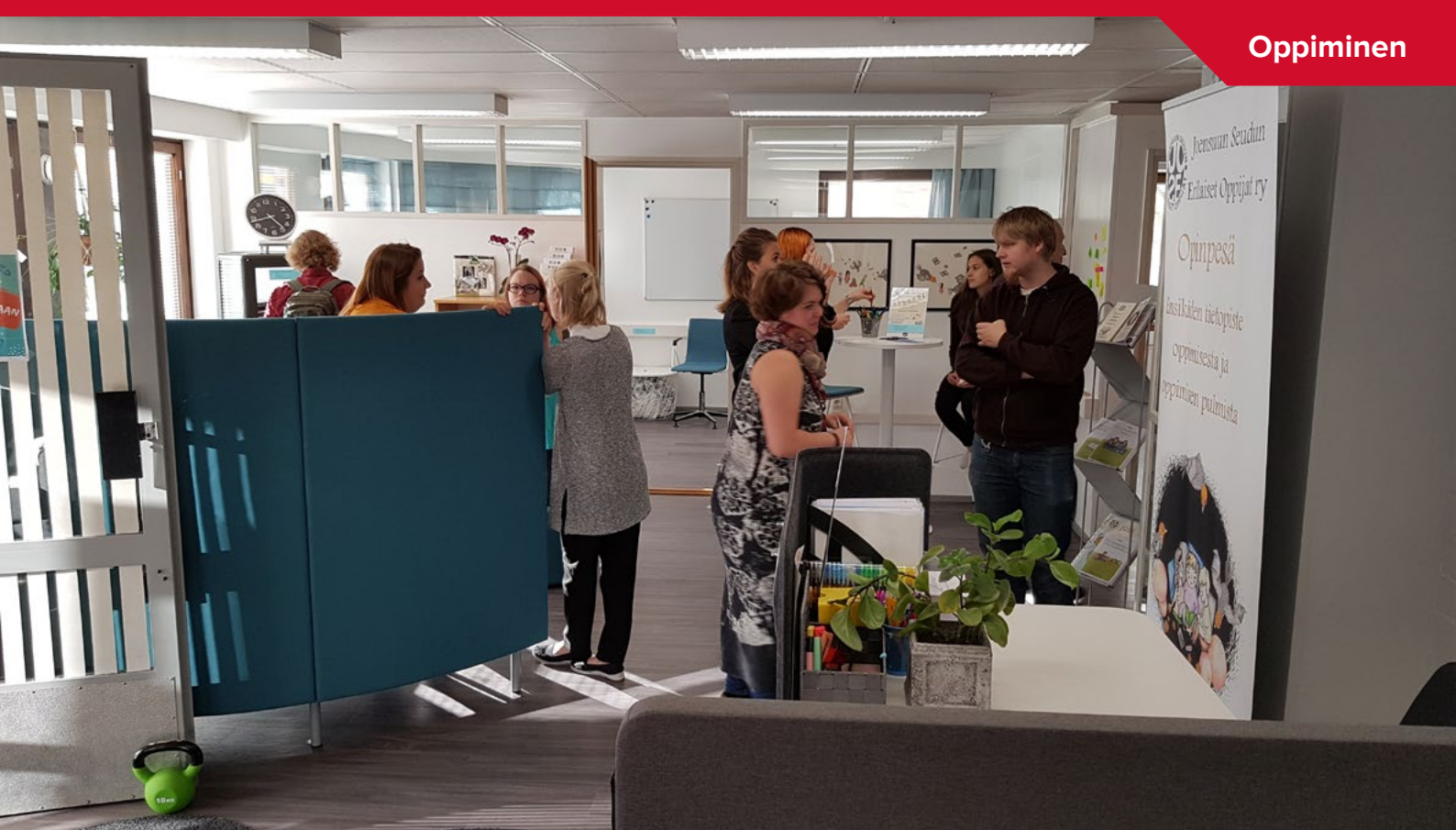
Elinikäisen oppimisen keskus -hankkeen avajaisia juhlittiin lokakuussa Joensuun seudun erilaisten oppijoiden toimitiloissa.